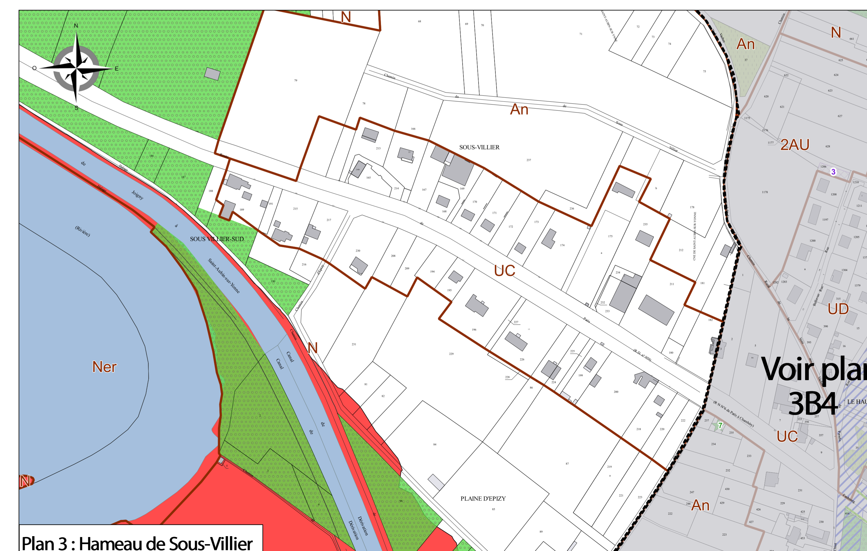
Voir plan 3B4